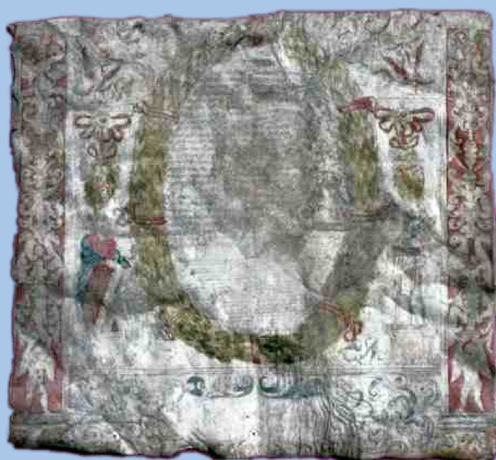
Ehevertrag aus dem Jahr 1676

■ 1954 verkaufte der Freistaat Bayern das Gebäude an die Raiffeisenkasse. Diese baute es um und nutzte den Bau bis zum Verkauf an den Markt Neunkirchen 1974 als Maschinenhalle. Ein zwischen Landkreis und Gemeinde 1989 gegründeter Zweckverband kümmerte sich um den Erhalt des Baus. Nach der Restaurierung fand 1994 die feierliche Wiederweihe der Synagoge statt. Heute beherbergen die Räumlichkeiten eine Dauerausstellung.