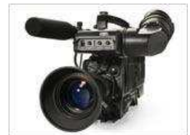
FOTO & VIDEO

Mit den WLZ-FZ-Videos können Sie sich zu allen Bereichen informieren, egal ob es sich um Nachrichten aus aller Welt handelt, um das Neueste aus Korbach oder die Filmtrailer der aktuellen Kinowoche. Für jeden Geschmack ist mit Sicherheit etwas dabei. mehr